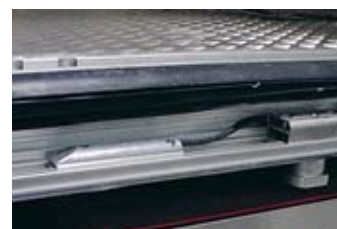
Låsningssystemet EkeGuard är integrerat i släpvagnens kantprofil.

EkeGuard har tagits fram i samverkan med kunderna och ett flertal system har redan tagits i drift i Finland och Sverige. Praktiken har visat att EkeGuard ökat säkerheten för både förare och laster.