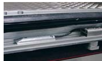
EkeGuard-lukitusjärjestelmä on integroitu perävaunun reunaprofiiliin.

myös osoittaneet EkeGuardin lisänneen kuljettajien ja kuljetusten turvallisuutta.